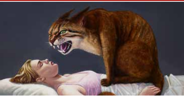
▲ Morgengruß Eitempera und Öl auf Leinwand, 2020