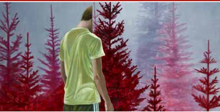
▲ Morgengruß Eitempera und Öl auf Leinwand, 2020