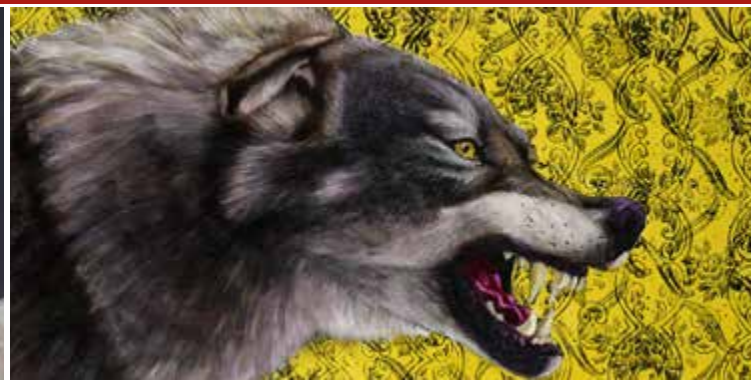
▲ Isegrim II Eitempera und Öl auf Leinwand, 2015