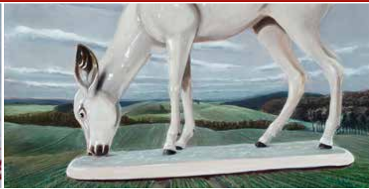
▲ Bambi on Tour I Eitempera und Öl auf Leinwand, 2017