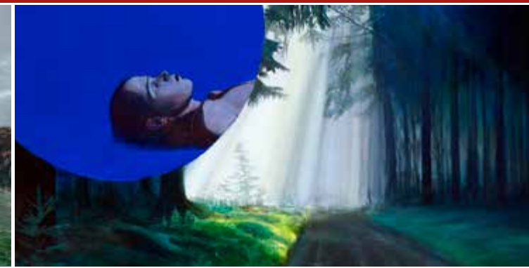
▲ Tief im Herzen rauscht der Wald III Eitempera und Öl auf Leinwand, 2013